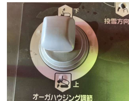
オーガハウジング調整レバー