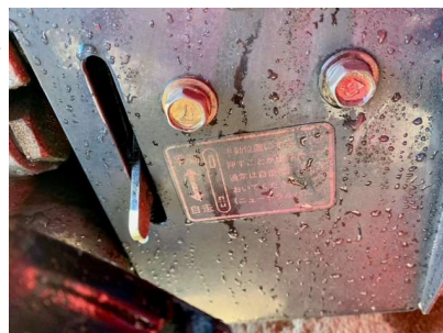
ニュートラルバルブレバー