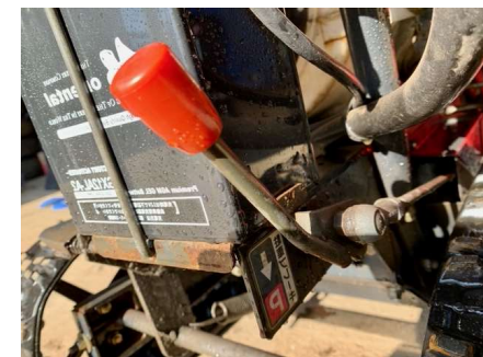
駐車ブレーキレバー