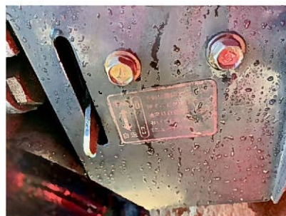
ニュートラルバルブ