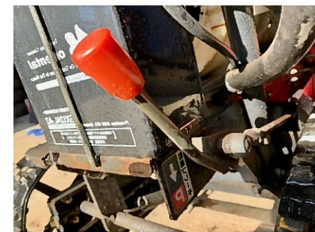
駐車ブレーキレバー